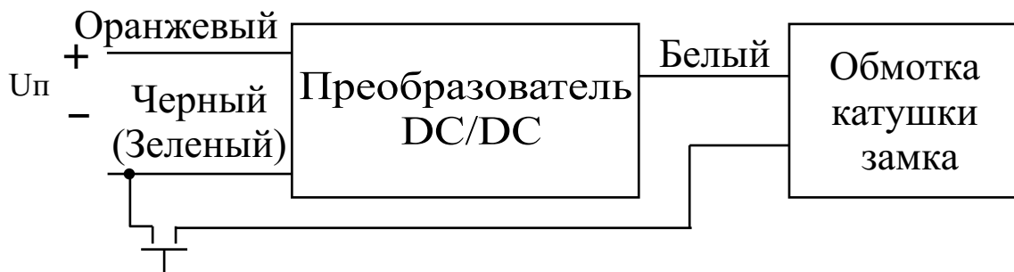
Схема включения преобразователя